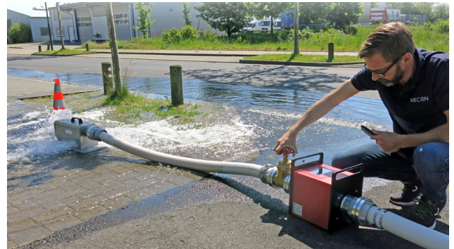
1) Vorbereitung für separate Trübungsmessung HTL TE / TU