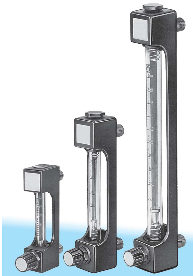
Рисунок 1 Поплавковый расходомер F VA Minix