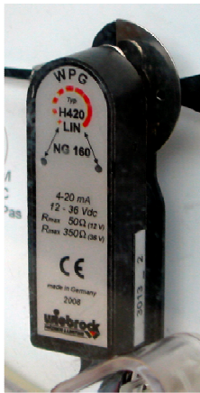
Abb.1: Drehwinkelgeber für F I Gardex